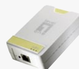
PLI-2040 200Mbps HomePlug AV Adapter