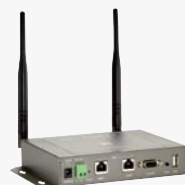
EAP-200 Enterprise Access Point